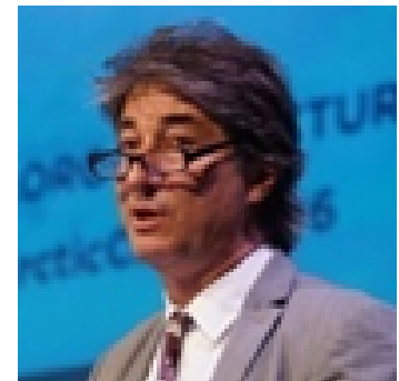
Лоран Майе специальный представитель Франции по полюсам